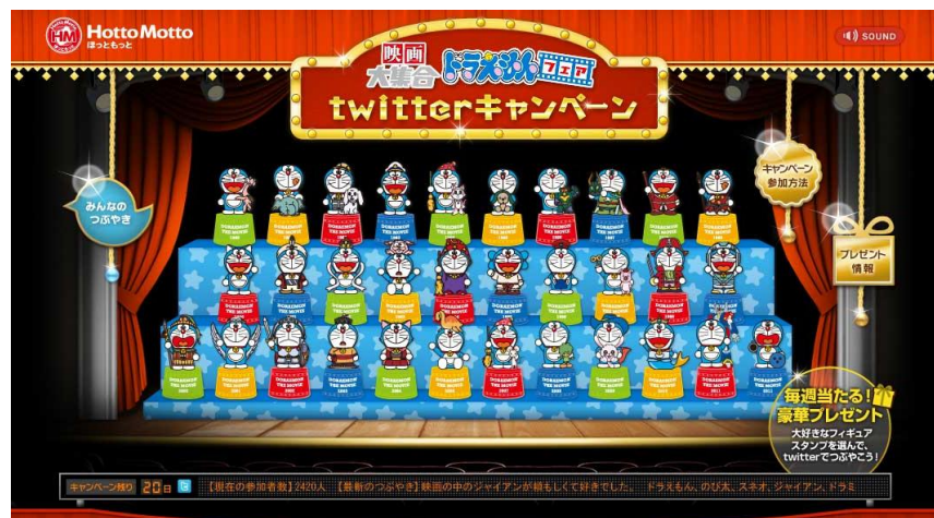
Twitter キャンペーンサイトイメージ

また、つぶやいていただいた方の中から毎週抽選で、総計25名の方に、「映画ドラえもんのDVD BOX」が当たる企画などもご用意しております。