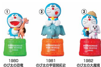
スタンプフィギュアの一例

対象商品を買うと、もれなくスタンプフィギュアをプレゼント。フィギュアは、映画ドラえもん全30作品のキャラクターで、「ほっともっと」オリジナルです。選んでもらえるので、全種類集める楽しさ倍増です。